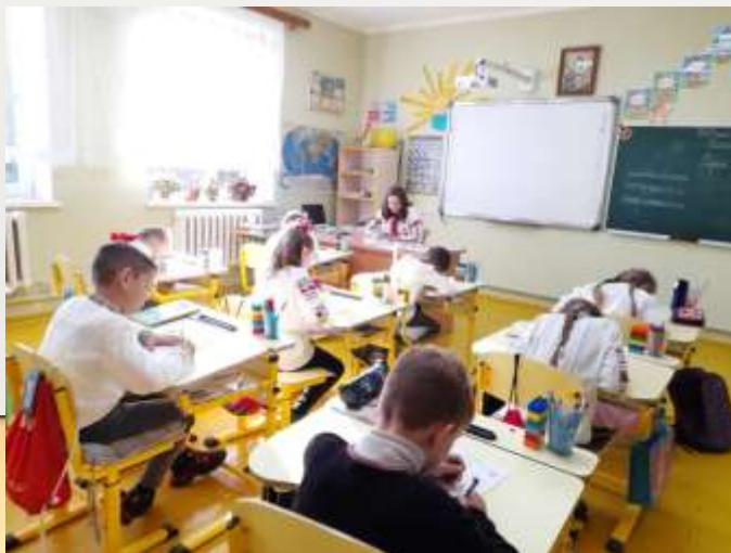
Радіодиктант національної єдності