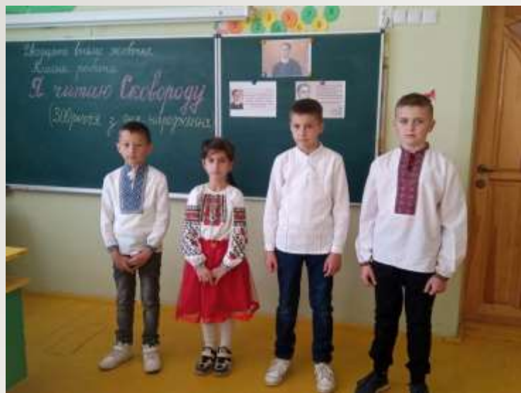
Я читаю Сковороду