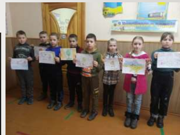
Конкурс малюнків «Охорона праці очима дітей»