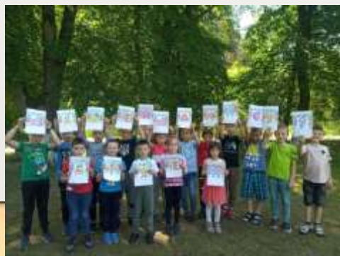
День захисту дітей