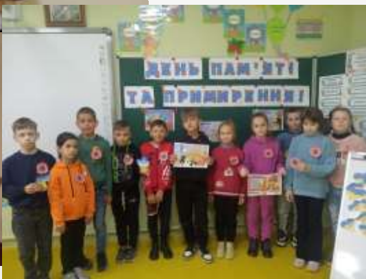
День пам'яті та примирення