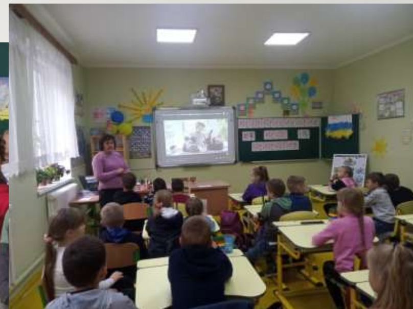
Всеукраїнський урок доброти