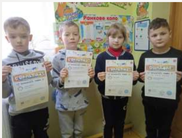
Олімпіада з української мови на сайті «Всеосвіта»

Брали участь у конкурсах сайту «На Урок»: «Подорож на Південний полюс», «Як це працює: водопровід та каналізація»