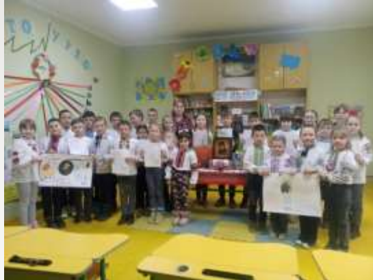
Шевченкові дні у школі