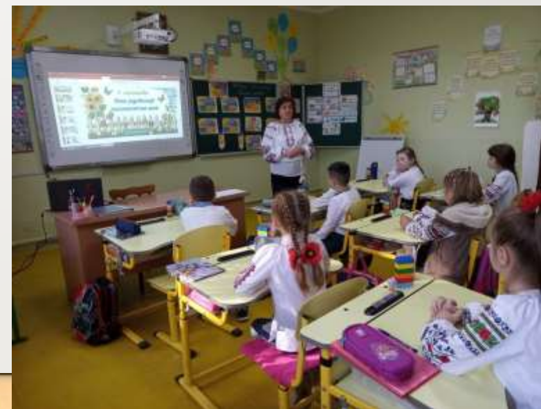
День української писемності та мови