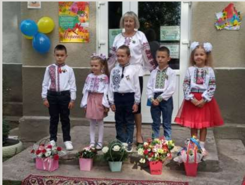
Свято Першого дзвоника