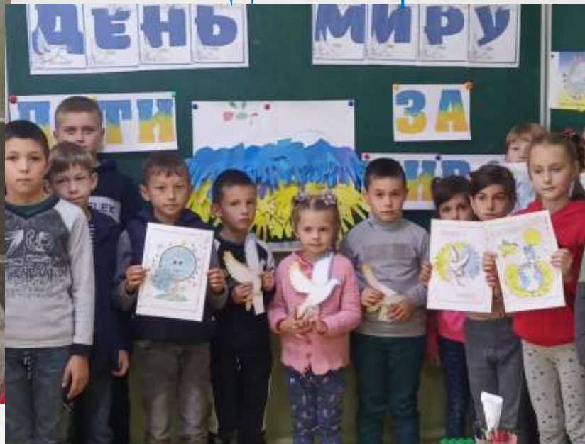
Флешмоб «Діти за мир»