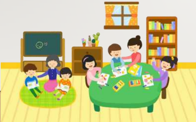
Шляхи до безпечного освітнього середовища