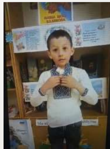
Онлайн-читання «Мова українська – мова єднання», «Єднаймо душі словом Кобзаря»

Всеукраїнська інтернет-олімпіада «На Урок» з предметів початкової школи