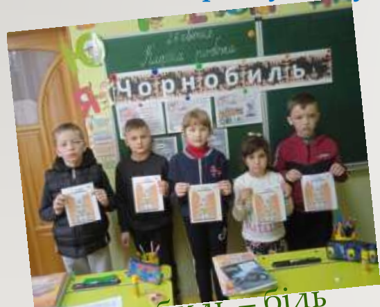
Чорнобиль – біль мого народу